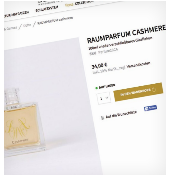
Produktansicht mit eindeutigen Call to actions

“Für Magento 2 sprechen nicht nur Leistung und Stabilität. Der größte Vorteil ist unserer Ansicht nach die Flexibilität der Software. Im Gegensatz zu Standard-Shoplösungen hat uns Magento 2 bei der Verwirklichung unserer individuellen Content-Commerce-Strategie keine Grenzen gesetzt – weder funktional noch technologisch.“