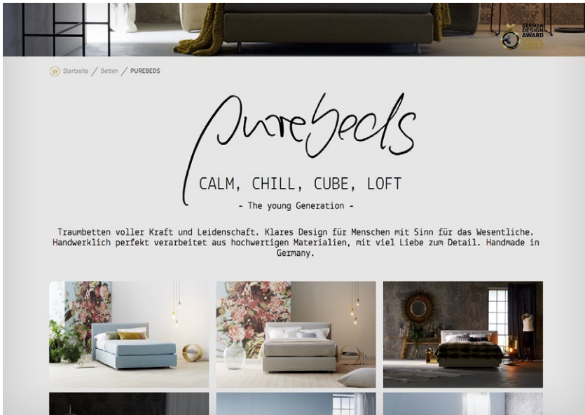
Emotionale Bilderwelten auf der Webseite