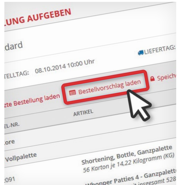
Dynamischer Bestellvorschlag aufgrund der Bestellhistorie

Bei der Konzeption und Umsetzung wurde auch besonderer Wert auf die Performance des Systems und dessen flexibler Skalierung gelegt, damit auch zu Peak-Zeiten keine Leistungseinbußen auftreten. Ein redundanter Systemaufbau stellt auch beim Ausfall einzelner Komponenten den stabilen Betrieb sicher. Darüber hinaus entwickelte netz98 die Bestellplattform als mandantenfähige und auch auf andere Formen der Systemgastronomie adaptierbare Multistore-Plattform. Eine intuitive Nutzerführung verkürzt die Schulungszeiten für neue Nutzer und hilft, Fehler zu vermeiden. Außerdem richtete netz98 umfangreiche Backendzugänge für Helpdesk-Anwendungen ein, um den Support zu erleichtern.